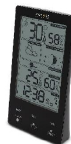
Identification of the apparatus

The object of the declaration described above is in conformity with the relevant Union harmonization legislation: